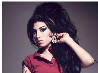
Эми Уайнхаус 27