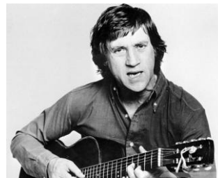
Владимир Высоцкий 42