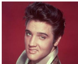
Элвис Пресли 42