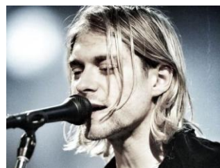
Курт Кобейн 27

Они были великими людьми, завоевавшими любовь целых поколений. У многих из них так и не появилось семьи. А у тебя будет семья? Они сделали неправильный выбор. Ты можешь не допустить такой же ошибки. Ты можешь выбрать счастливую жизнь.