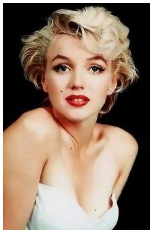
Мэрилин Монро 36