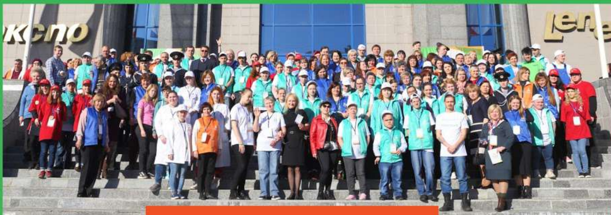
ФОТО КОМАНДЫ САНКТ-ПЕТЕРБУРГА С РЕГИОНАЛЬНОГО ЧЕМПИОНАТА

Региональный центр развития движения «Абилимпикс» Санкт-Петербург