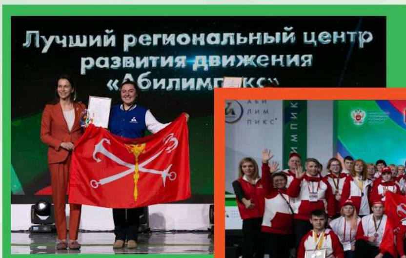
ФОТО КОМАНДЫ САНКТ-ПЕТЕРБУРГА С НАЦИОНАЛЬНОГО ЧЕМПИОНАТА

Региональный центр развития движения «Абилимпикс» Санкт-Петербург