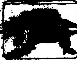
Проплыть на лед ногой, отталкиваясь от ледяных крошек