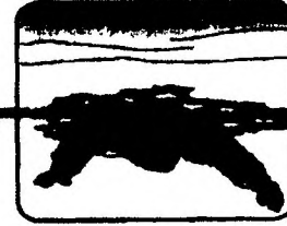
Наползти на лед, раскинув руки в стороны

НАПОМИНАЕМ ВАМ , что за выход на лед в запрещенный период, установленный постановлением Правительства Санкт-Петербурга «Об установлении периодов, в течение которых запрещается выход на ледовое покрытие водных объектов в Санкт-Петербурге», предусмотрена административная ответственность в соответствии со ст. 43-6 Закона Санкт-Петербурга от 12 мая 2010 года № 273-70 «Об административных правонарушениях в Санкт-Петербурге».