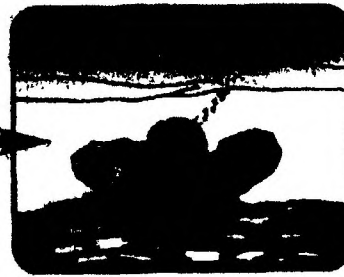
Выбраться в сторону, с которой произошло падение