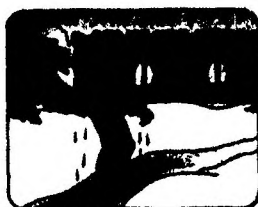
Не отдыхая, бежать к ближайшему жилью