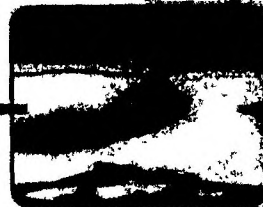
Проплыть к берегу по своим силам