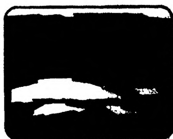
Не погружаться в воду с головой